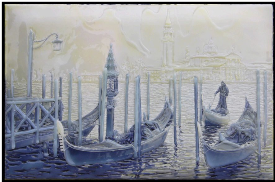
VENEZIA nella nebbia , 49 x 74 cm.