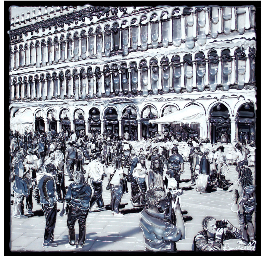
VENEZIA, PIAZZA S. MARCO , 80 x 80 cm. Stampa fotografica e vinilico su tela