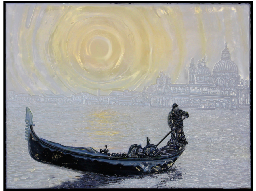
VENEZIA, tramonto algido, 60 x 80 cm Stampa fotografica e vinilico su tela