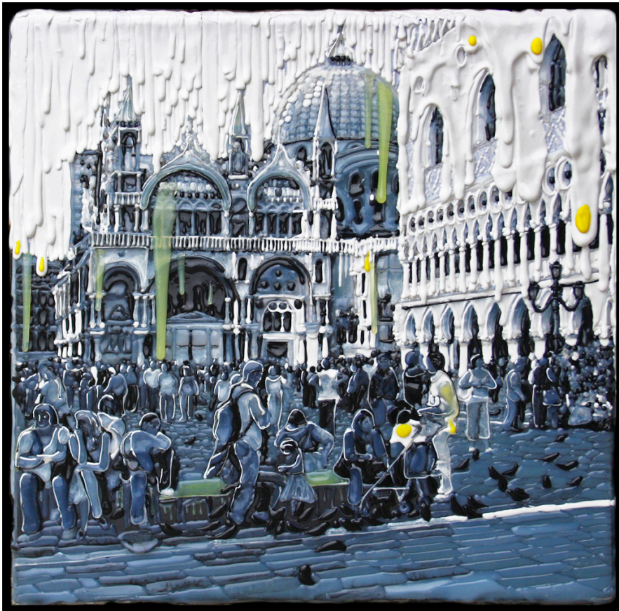
VENEZIA, Piazza S. Marco con uova, 60 x 60 cm. Stampa fotografica e vinilico su tela