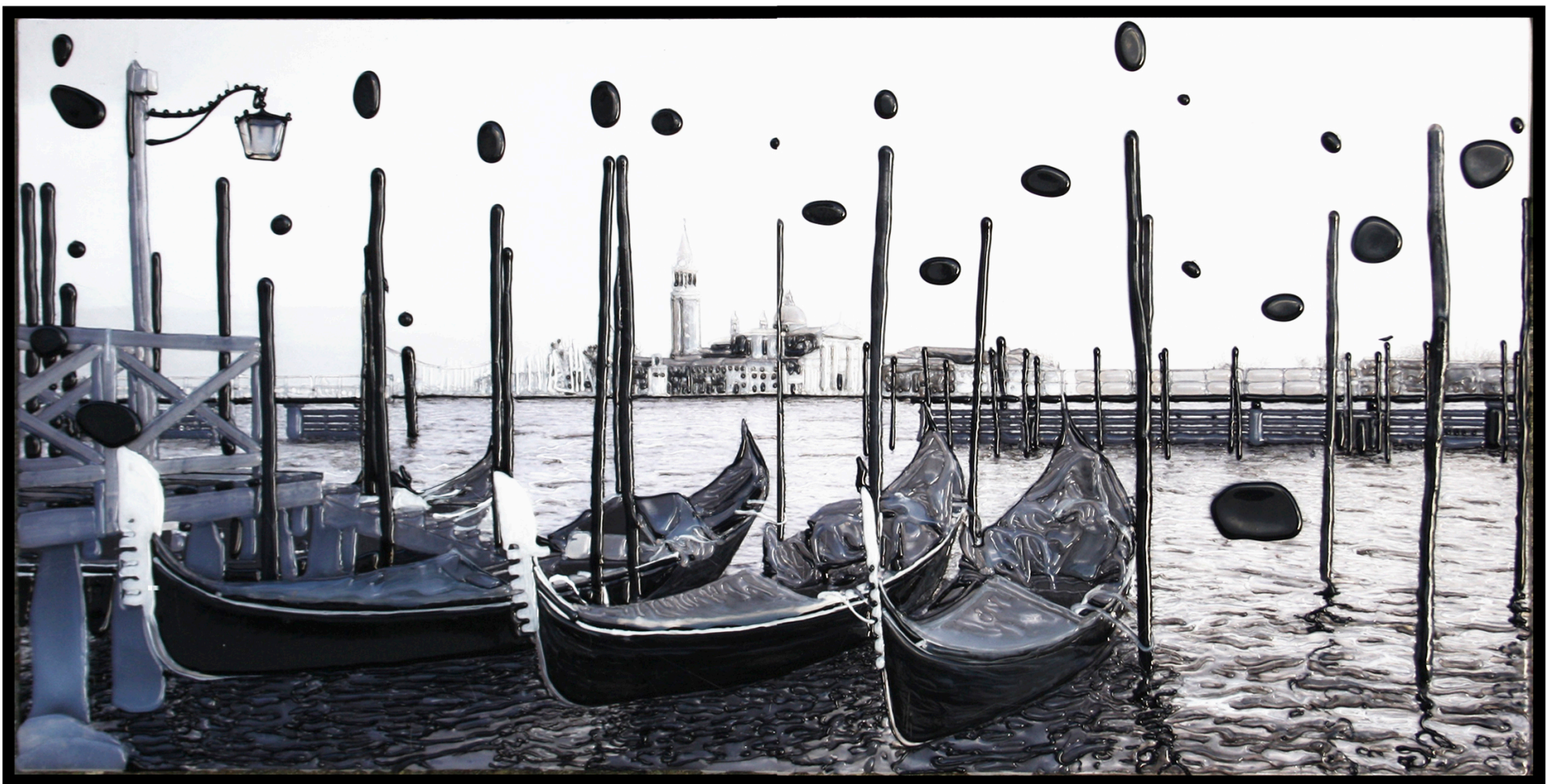
VENEZIA, paesaggio con bolle, 50 x 110 cm.