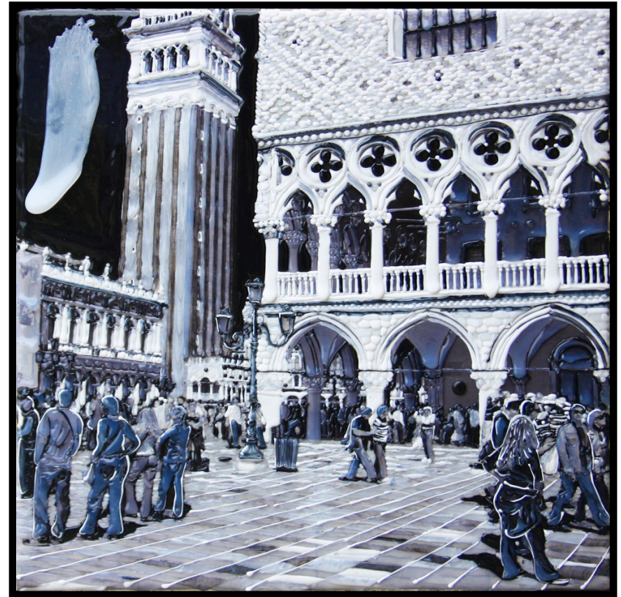
VENEZIA, campanile di S. Marco 50 x 50 cm. Stampa fotografica e vinilico su tela